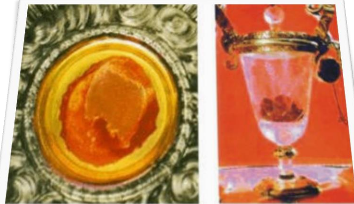
O MILAGRE EUCARÍSTICO DE LANCIANO

Há tempos, foi traçado na Europa um “mapa eucarístico”, que registra o local e a data de mais de 130 milagres, metade deles ocorridos na Itália. Em seu livro o professor relata sete dos mais importantes e que tem a credibilidade da Igreja.