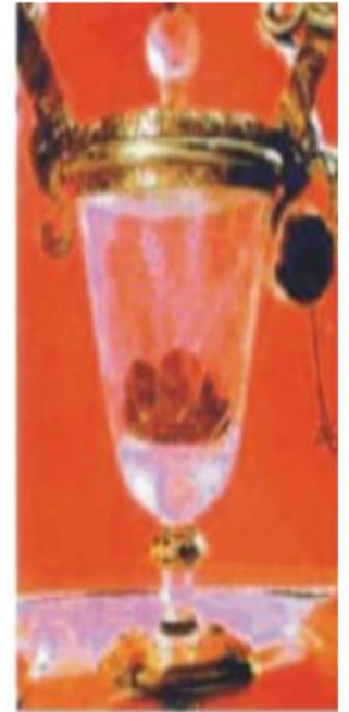
O MILAGRE EUCARÍSTICO DE LANCIANO